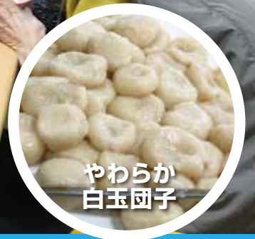
やわらか白玉団子